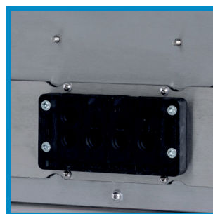
Variable Kabeldurchführung Variable cable gland