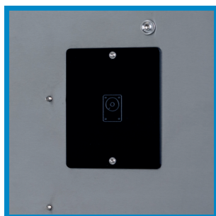
Festplatten-Wechselschacht Hard disk quick-change frame