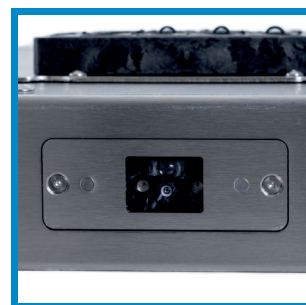
Optionaler Barcodescanner Optional barcode scanner